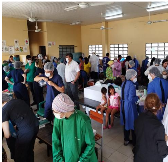
Figura 3. Recursos Físicos