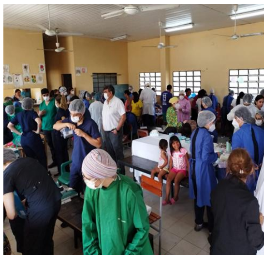
Figura 3. Recursos Físicos